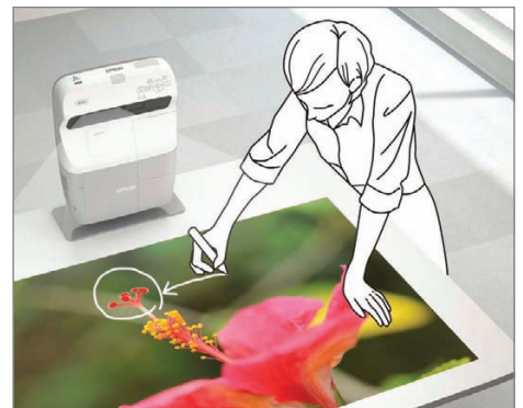
Projection sur toute surface horizontale, comme le plateau d'un bureau